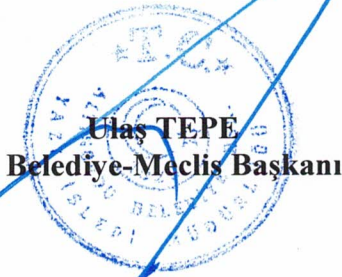
Ulaş TEPE Belediye-Meclis Başkanı

Rapor komisyondan geldiği şekliyle oylandı ve işaretle yapılan oylamada; mevcudun oybirliğiyle kabul edildi.